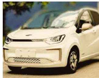
JAC e-JS1 Perto de R$ 126.900

A entrada do Caoa Chery iCar no mercado de carros elétricos brasileiro demonstra o compromisso da marca em oferecer tecnologia e sustentabilidade a um preço acessível. A medida que mais consumidores buscam alternativas ecológicas, modelos como o iCar são fundamentais para facilitar essa transição.