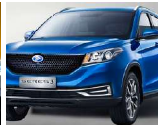
Seres 3 Por volta de R$ 199.990

O Hyundai Kona EV é um exemplo do compromisso da Hyundai com a mobilidade elétrica e a inovação automotiva. Este modelo não só atende à demanda crescente por veículos mais sustentáveis como também oferece aos consumidores uma opção que combina praticidade, conforto e desempenho em um pacote elétrico. Sua presença no mercado brasileiro é uma demonstração da confiança da Hyundai no potencial dos carros elétricos no país e sua aposta no futuro dessa tecnologia.