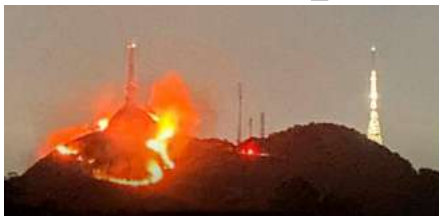
Incêndio Consome Vegetação no Pico do Jaraguá, o Ponto Mais Alto de São Paulo.

Um incêndio significativo atingiu a vegetação do Pico do Jaraguá, na Zona Norte de São Paulo, na noite do último sábado (27). As chamas foram controladas na virada do dia, conforme informações do Corpo de Bombeiros, que não reportou vítimas.