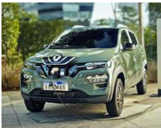
Renault Kwid E-Tech Aproximadamente R$ 99.990

O Renault Kwid E-Tech se destaca como o carro elétrico com preço mais acessível no Brasil em 2024.