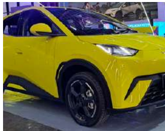
BYD Dolphin Mini Cerca de R$ 115.800

Ao posicionar o Kwid E-Tech como o carro elétrico mais barato do Brasil, a Renault não apenas oferece uma opção viável para muitos consumidores, mas também pressiona outros fabricantes a considerarem estratégias de preço mais agressivas. Isso pode levar a uma maior adoção de veículos elétricos no país, contribuindo para um ambiente mais limpo e sustentável.