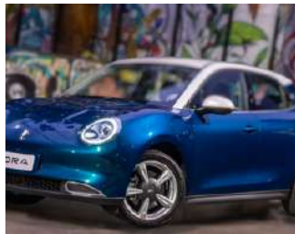
GWM Ora 03 Aproximadamente R$ 150.000

A chegada do BYD Dolphin ao mercado brasileiro reflete a crescente demanda por carros elétricos que oferecem um bom equilíbrio entre preço e desempenho.