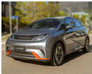
BYD Dolphin Em torno de R$ 149.800

Este é um passo acima do modelo Mini, com mais recursos, maior autonomia e uma experiência de condução superior, justificando o preço ligeiramente superior.