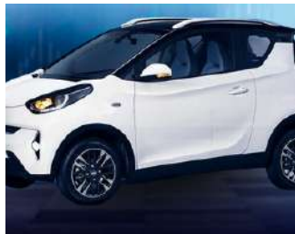
Caoa Chery iCar Por volta de R$ 119.990

A introdução do BYD Dolphin Mini no mercado brasileiro é um sinal claro da evolução do setor de veículos elétricos no país. Ele oferece uma opção mais acessível sem comprometer os avanços tecnológicos, contribuindo para a popularização da mobilidade elétrica.