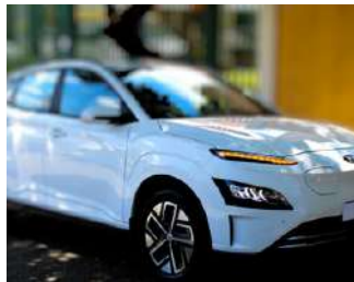
Hyundai Kona EV Cerca de R$ 189.990

O design do GWM Ora 03 é talvez um dos seus aspectos mais marcantes. Com uma estética futurista e linhas suaves que fluem ao longo do corpo do carro, este modelo se destaca tanto por sua beleza quanto por sua eficiência aerodinâmica. A frente do veículo apresenta uma grade distintiva que enfatiza sua identidade elétrica, enquanto a traseira é elegante e moderna.