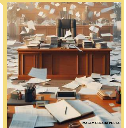
IMAGEM GERADA POR IA

Pois sem um líder para a educação, perde-se mais que a direção; perde-se a chance de um futuro brilhante, de um CMBAJU forte, perene e vibrante.