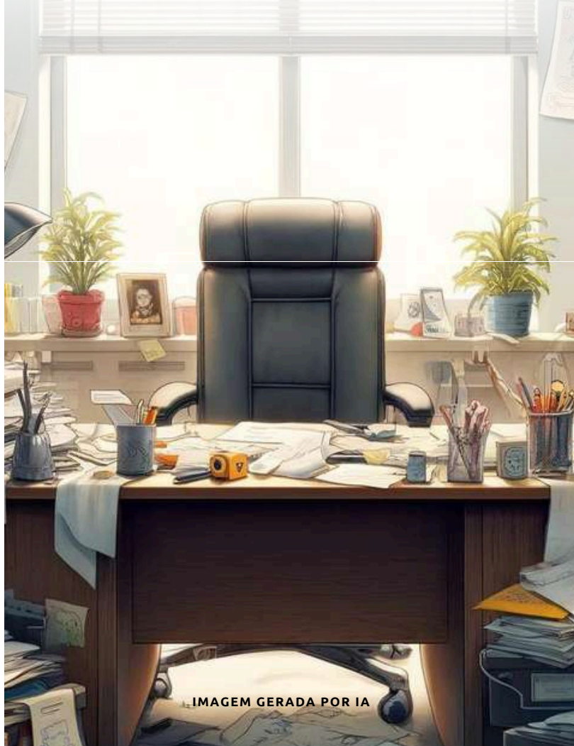
IMAGEM GERADA POR IA

Comprar Apartamento em Caieiras? Não, Obrigado.