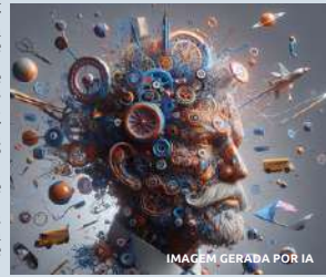
IMAGEM GERADA POR IA

Por fim, a pergunta que deixo ao leitor é simples, porém profunda: que tipo de futuro estamos cultivando nas nossas escolas hoje? A resposta a essa pergunta definirá não apenas a trajetória de nossos jovens, mas o próprio destino da nossa sociedade.