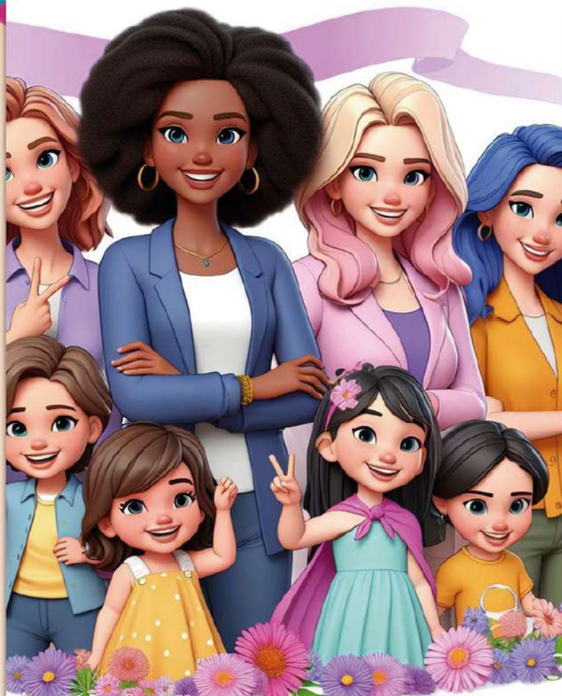
Imagem gerada por IA.

Viva a Adrenalina no Rope Jump em Mairiporã! (pg.8)