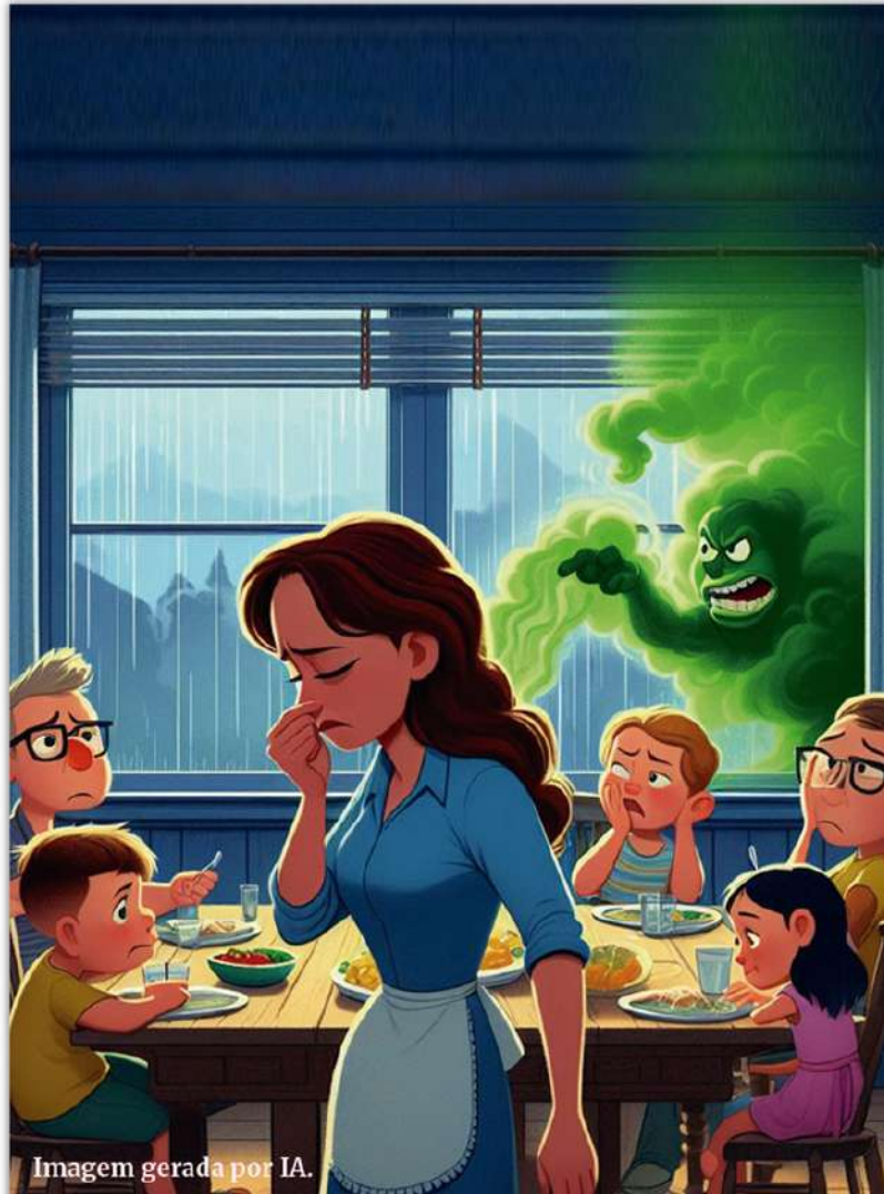
Imagem gerada por IA.

Você que completa 18 anos neste ano. Faça a sua inscrição para o Alistamento Militar (pg.8)