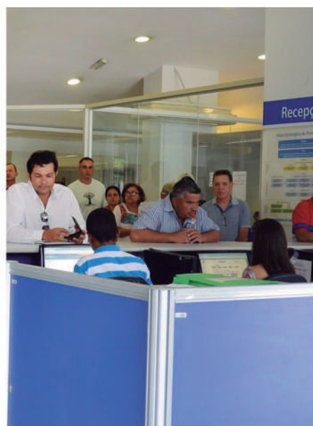
*Com informações da Agência Brasil

"Temos uma pauta muito forte junto ao Ministério da Previdência, mas temos também uma pauta muito forte em relação à questão tributária. Temos projetos que visam incentivar o trabalhador a poupar. Não se trata de renúncia, mas simplesmente de um diferimento para quando ele for receber o benefício, ele paga o tributo. Temos então uma pauta de sete projetos de lei na parte tributária. Nessa parte de benefícios, temos simplificação, desoneração dos fundos, transparência. Temos feito as demandas junto ao ministério e temos sido bem atendidos. Sentimos que o ministério tem trabalhado no fortalecimento da Previdência Privada Fechada".