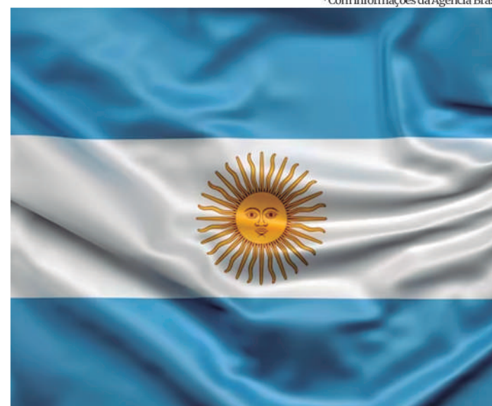
*Com informações da Agência Brasil.

Pela constituição argentina, a vitória em primeiro turno também ocorre caso algum dos candidatos receba apenas 40% dos votos válidos, mas com uma diferença de pelo menos dez pontos sobre o segundo mais votado. Até o momento, as pesquisas não apontaram a ocorrência de nenhuma das situações e indicam um provável segundo turno.