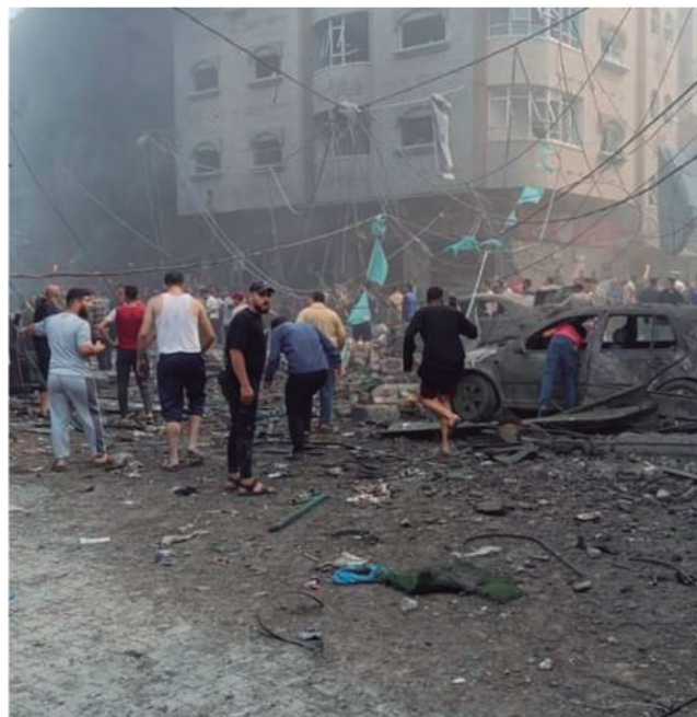
*Com informações da Agência Brasil.

“Dezenove unidades de saúde foram direta ou indiretamente visadas, forçando a interrupção do trabalho em 14 centros de saúde afiliados ao sistema de cuidados primários do Ministério da Saúde na Faixa de Gaza. Todas as instalações de saúde correm o risco de paralisação total devido a cortes de energia e à grave escassez de combustível.”