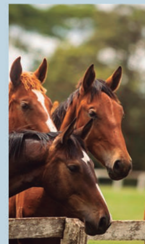
*Com informações da Agência Brasil

Somente em 2023, foram 27 mil novos cadastros. Além disso, a partir de 2024, a atualização do cadastro poderá ser feita duas vezes ao ano, em maio e novembro, juntamente com outros rebanhos. A secretaria de Agricultura também vai encaminhar à Assembleia Legislativa de SP um projeto de lei que cria o Passe Equestre, uma alternativa à Guia de Trânsito Animal para o transporte de animais. Com o passe, o criador poderá movimentar seus rebanhos de equinos para áreas livres por todo o período de validade dos exames necessários e do atestado de vacinação. Por fim, será criado um grupo de trabalho para a elaboração de um regulamento técnico de bem estar animal para eventos agropecuários. O documento servirá para regular as boas práticas de manejo dos animais.