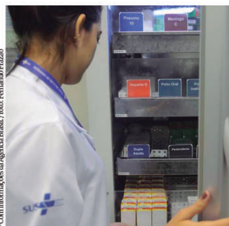
*Com informações da Agência Brasil / foto: Fernando Frazão

Antes, os congressistas votaram diversos vetos do então presidente Jair Bolsonaro. Eles derrubaram o veto total (59/22) ao projeto de lei que reabre o prazo para dedução, no Imposto de Renda, das doações feitas a dois programas de assistência a pacientes com câncer e a pessoas com deficiência: os programas nacionais de apoio à atenção Oncológica (Pronon) e da Saúde da Pessoa com Deficiência (Pronas/PCD). A nova abertura de prazo valerá até o ano-calendário de 2025 para as pessoas físicas e até o ano-calendário de 2026 para as pessoas jurídicas.