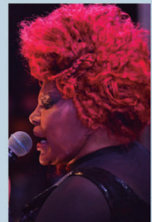
*Com informações da Agência Brasil

A portaria cria um grupo de trabalho para elaborar, em 90 dias, nova proposta para selecionar homenageadas pela lista de personalidades notáveis negras da entidade.