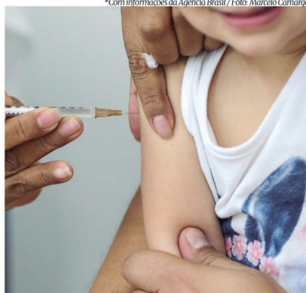
*Com informações da Agência Brasil

Em nota, a Fiocruz informou ainda que a pesquisa não conseguiu determinar se o imunizante reduziu hospitalizações e óbitos em razão do baixo número de participantes que desenvolveu quadros graves de covid-19. Profissionais de saúde foram priorizados na vacinação contra a covid-19 e as doses reduzem casos graves e mortes.