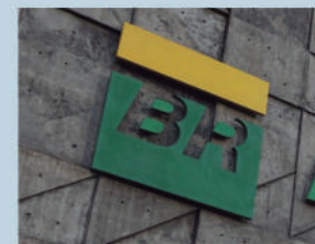
*Com informações da Agência Brasil

Estão mantidas as diretorias de Exploração e Produção e de Governança e Conformidade.