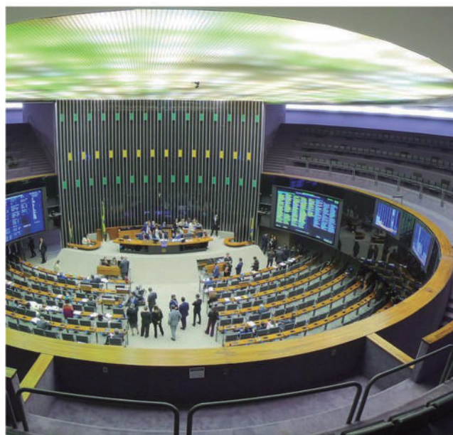
*Com informações da Agência Brasil

As comissões parlamentares de inquérito têm poderes de investigação semelhantes às autoridades judiciais. Pode convocar autoridades, requisitar documentos e quebrar sigilos pelo voto da maioria dos integrantes.